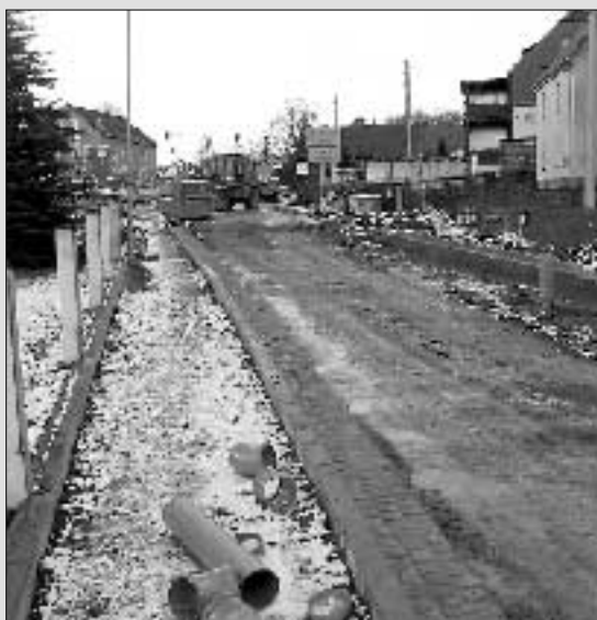
während der Bauarbeiten