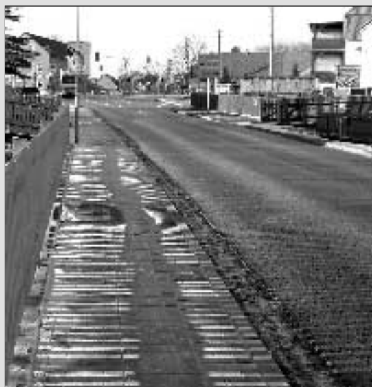
nach der Fertigstellung